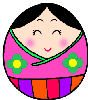
学校マスコットキャラクター とよまつ ひめまつ